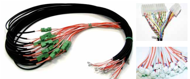
Exempel på produktutförande, infästning och anslutningar