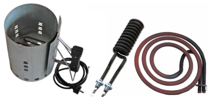
Exempel på produktutförande