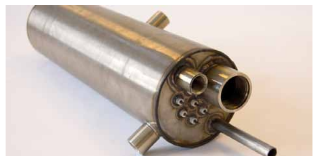
Exempel på produktutförande