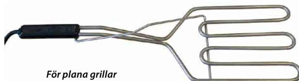
För plana grillar