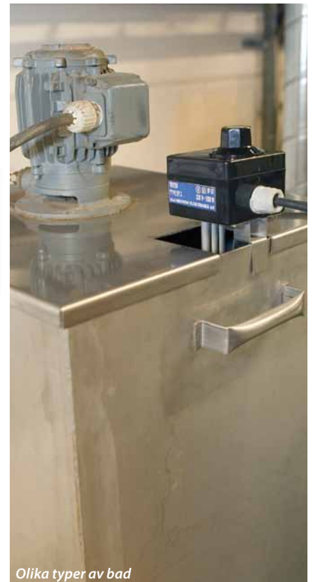
Olika typer av bad