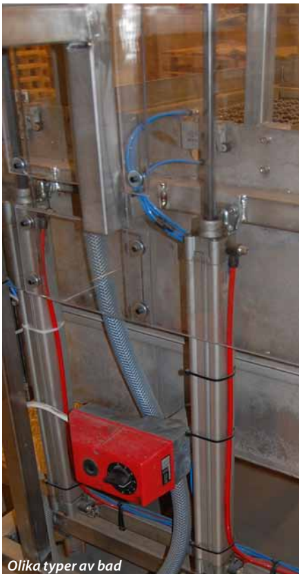
Olika typer av bad